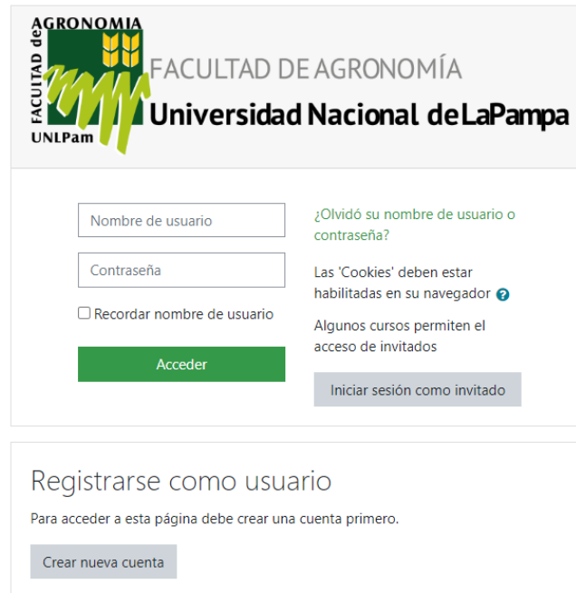
Figura 2: acceso de usuarios invitados